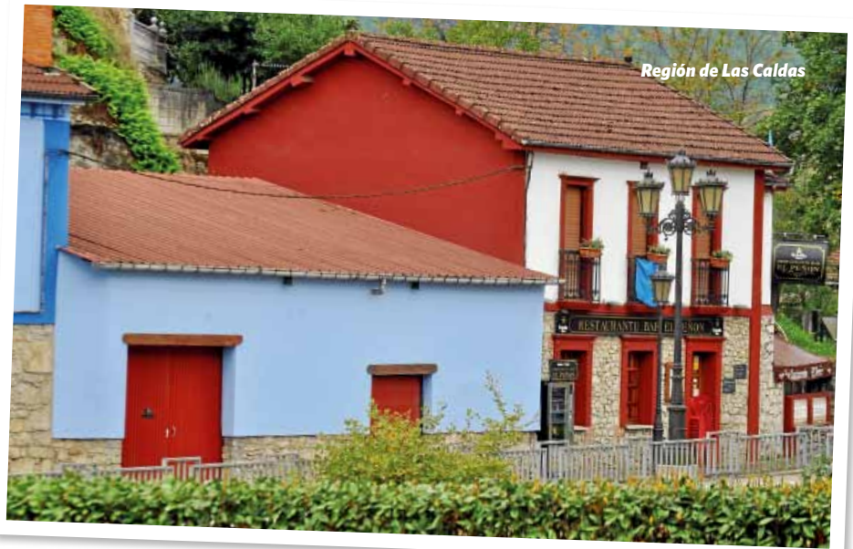
Región de Las Caldas

Los asientos de la clase Turista son ergonómicos, más anchos y disponen de más espacio entre asientos. Con pantalla individual de 9", los pasajeros pueden disfrutar del mismo programa de entretenimiento que en clase Business: 50 películas en diferentes idiomas, 80 series de TV y documentales, 400 opciones musicales y videojuegos.