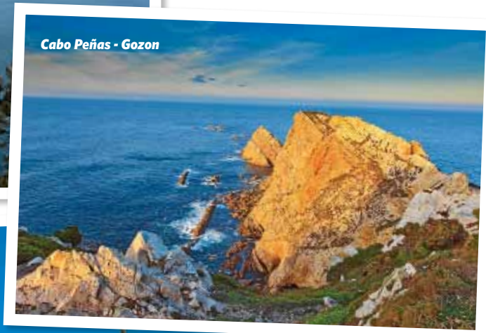
Cabo Peñas - Gozon

M irar el mapa de España y situar al Principado de Asturias es fácil: nos vamos a la parte superior de la Península Ibérica y justo en el centro de la cornisa, entre las provincias de Cantabria y Galicia, lindando al norte con el mar Cantábrico y al sur con la milenaria cordillera de los Picos de Europa, nos encontramos esta pequeña y escarpada región de altas montañas, profundos valles y costa entrecortada, forjada por una gran variedad de paisajes y contrastes.