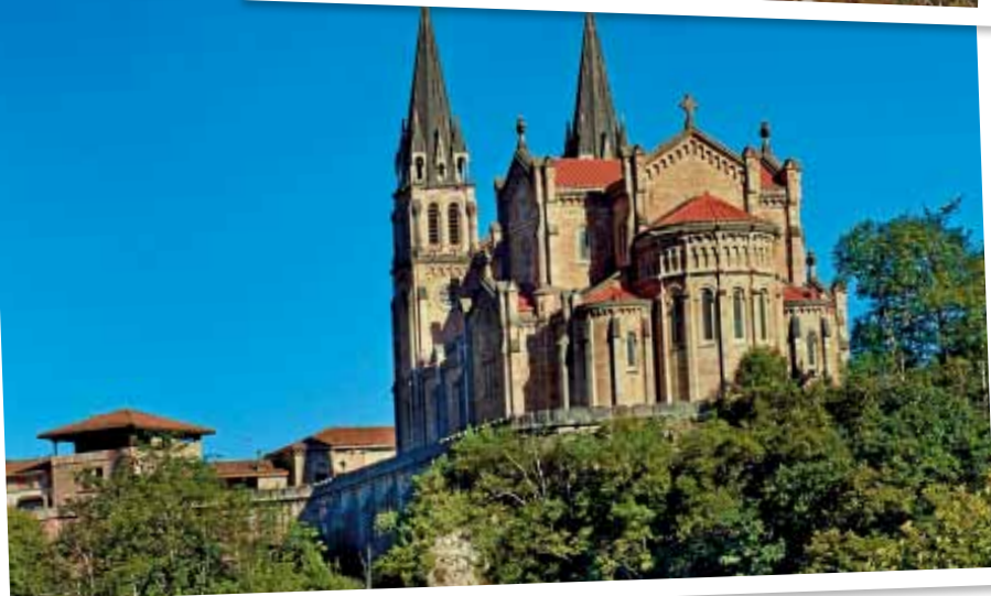
Basilica de Covadonga - Cangas de Onis

rona española llevan el título de Príncipes o Princesas de Asturias.